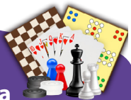
La Boîte à Jeux